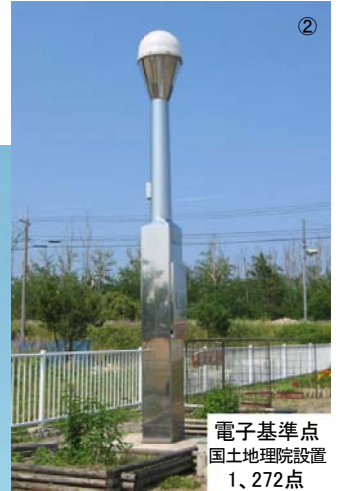
電子基準点 国土地理院設置 1、272点