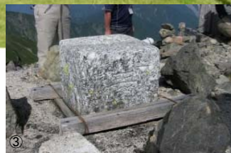
最高標高の一等三角点「赤石岳」 長野県下伊那郡大鹿村 北緯 35度 27分 29秒 東経 138度 9分 38秒 標高 3120m