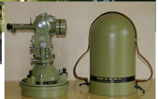
三角点の観測に使用した測量器 WILD(現ライカ)社製:特級経緯儀